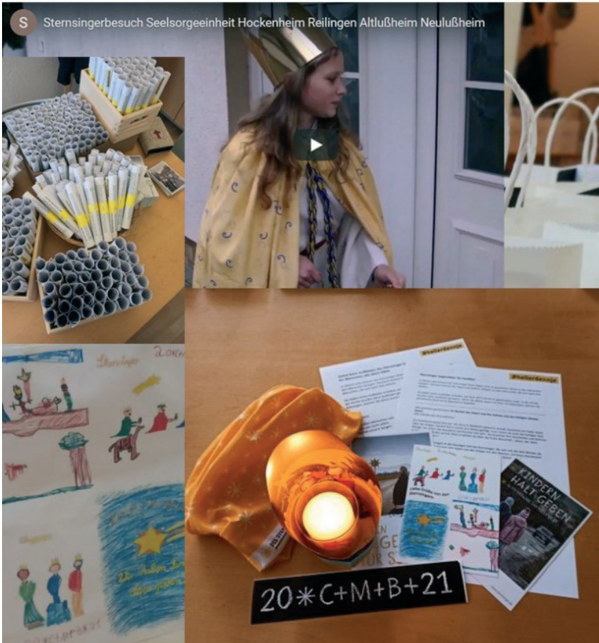
S Sternsingerbesuch Seelsorgeeinheit Hockenheim Reilingen Altlußheim Neulußheim