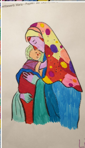
Ökumenische Kinderkirche, Wettbewerb: Maria und Christi Himmelfahrt Mal Wettbewerb: Maria - PopART der Ökumenischen Kinderkirche Ansbach