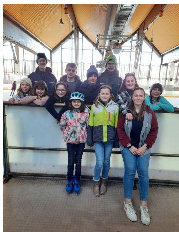
Foto vom Miniausflug zur Eisbahn nach Wiesloch

21:00 Uhr Feier der Osternacht in Hockenheim